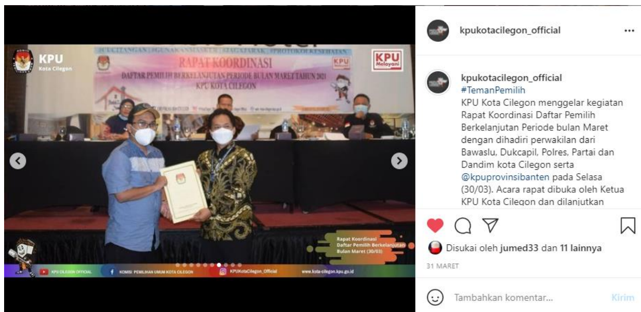
Gambar 1. Rapat Koordinasi Daftar Pemilih berkelanjutan Periode Bulan Maret dgn Stake Holder terkait.