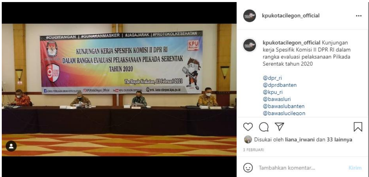
Gambar 6. Foto kunjungan kerja Spesifik Komisi II DPR RI ke KPU Kota Cilegon dalam rangka evaluasi pelaksanaan Pilkada Serentak tahun 2020.