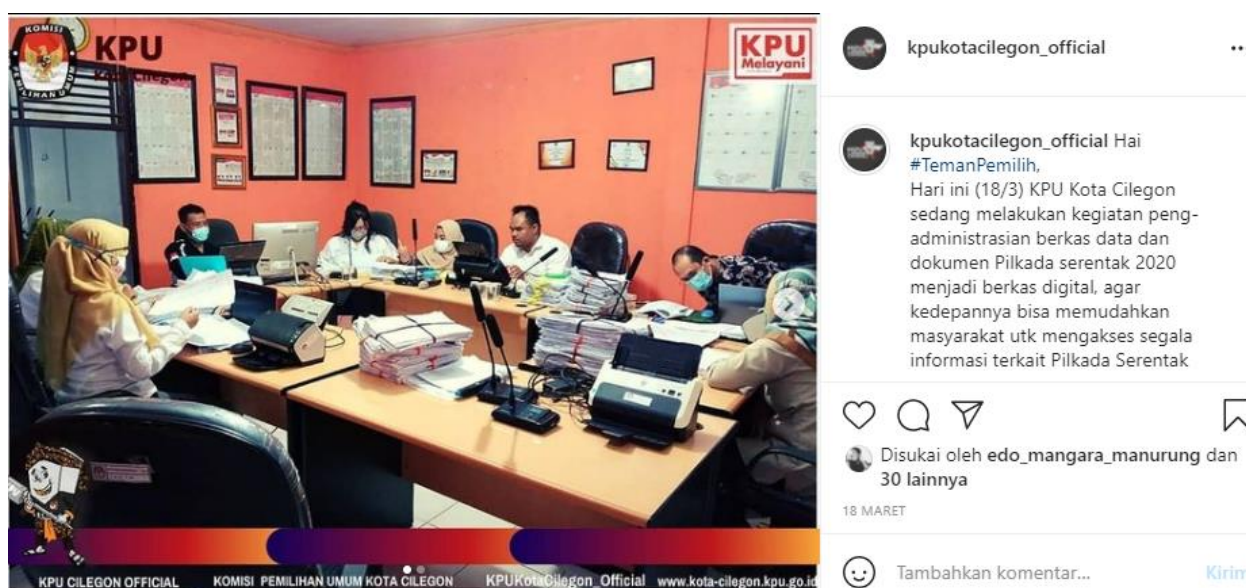
Gambar 2. Foto KPU Kota Cilegon Melakukan Pengadministrasian berkas Data dan Dokumen Pilkada serentak 2020 menjadi berkas digital.