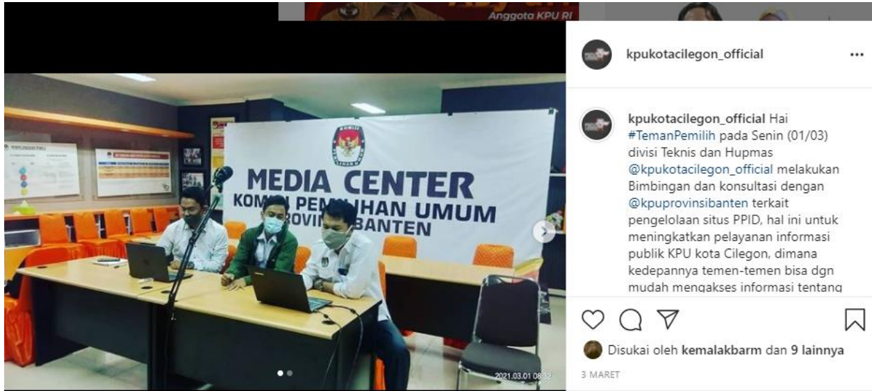
Gambar 5. Foto Divisi Teknis dan Parmas KPU Kota Cilegon melakukan bimbingan dan konsultasi terkait pengelolaan PPID dgn KPU Provinsi Banten.