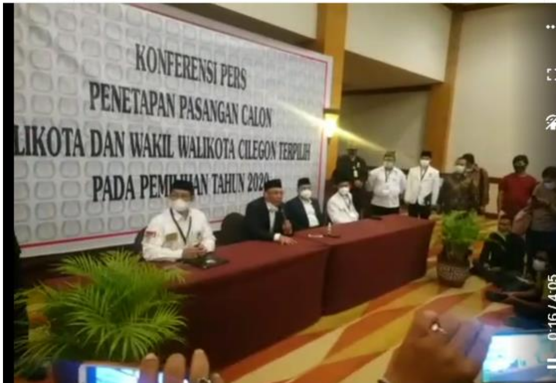
Gambar 7. Konfrensi Pers Pasangan Walikota dan Wakil Walikota Terpilih Kota Cilegon 2020 pada acara Rapat Pleno terbuka Penetapan Pasanga Terpilih.